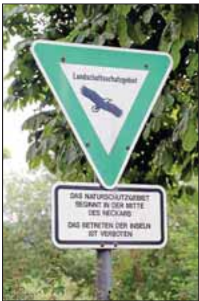
Auf den Schwemmseln im Altneckar leben seltene Tierarten. Deshalb ist das Betreten dieser Inseln verboten.

Um diese „landschaftlichen Begleitmaßnahmen“ ging es auch 1995. Damals sollte die verlandete „Schlut“ geflutet werden. Eine „Schlut“ ist die schlammige Rinne in einer Flussaue, die nur bei Hochwasser überflutet wird. Damals ging es nach einem Hochwasser um die Landschaftspflege in Verbindung mit dem