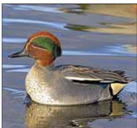
Einen Fischadler mit Beute kann man am Altneckar genauso beobachten wie eine männliche Krickente.