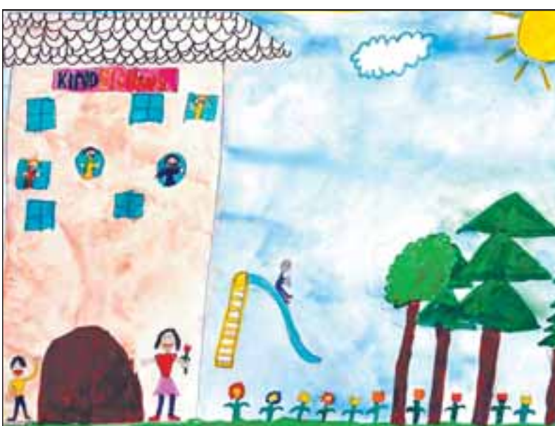
Lev Gromov (9), Heidelberg