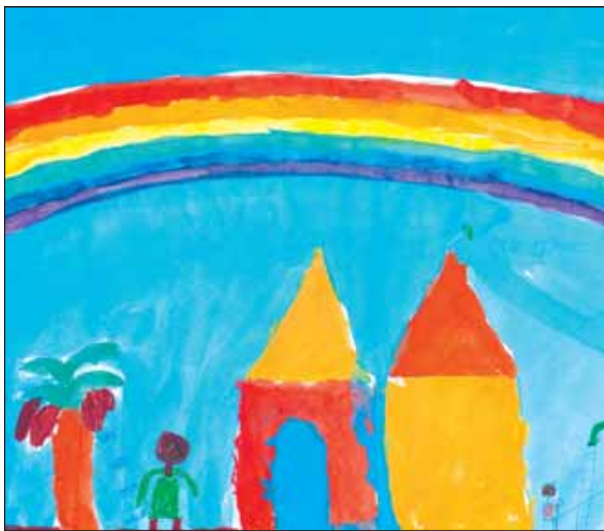
Max Ach, 3. Klasse, Grundschule Altenbach